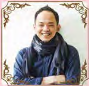
ミヤケサン HP製作承ります。