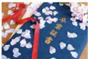
事務です。すーさんblog